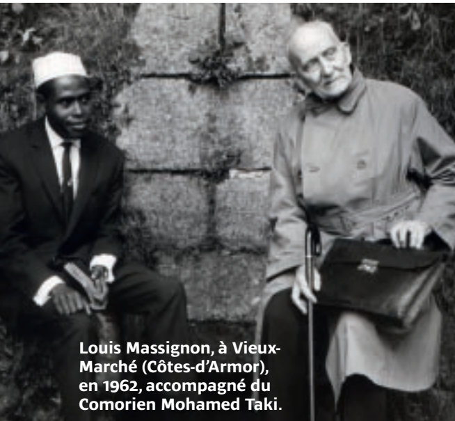
Louis Massignon, à Vieux-Marché (Côtes-d'Armor), en 1962, accompagné du Comorien Mohamed Taki.

Pour le récent cinquantenaire de sa mort, de nombreux hommages ont été rendus à Louis Massignon (1883-1962), orientaliste et créateur du pèlerinage islamo-chrétien des Sept Dormants dans les Côtes-d'Armor.